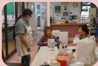
美容クラブの指導もして下さる DIC

日の出町社会福祉協議会を通じ常時3名と1業者の方がボランティアとして活動されています。